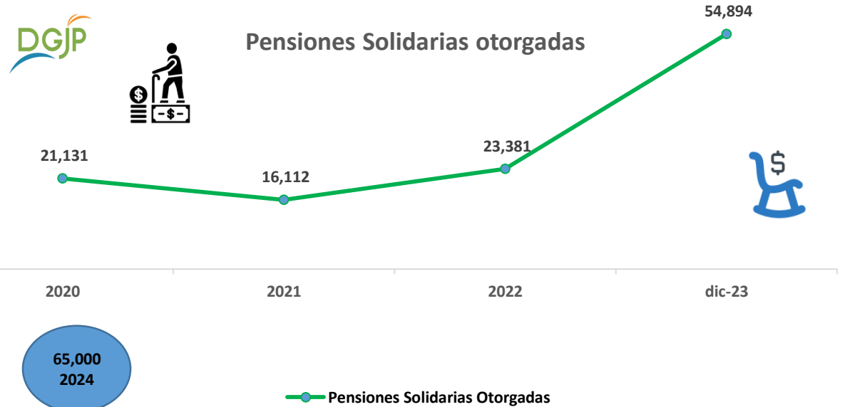
Pensiones Solidarias otorgadas

Meta para el 2024 65,000 Pensiones Solidarias