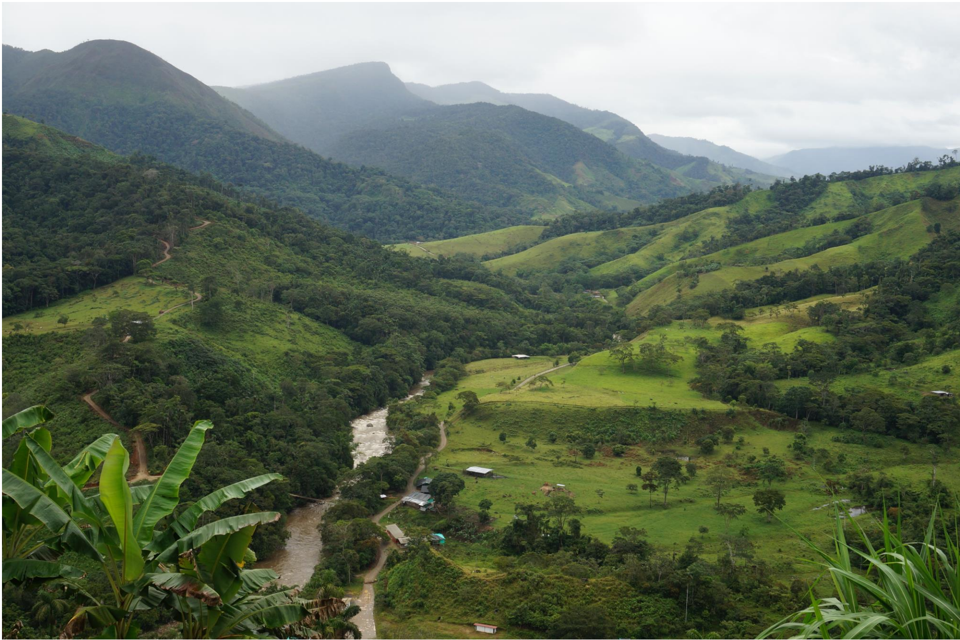
Miravalle, San Vicente del Caguán, Caquetá