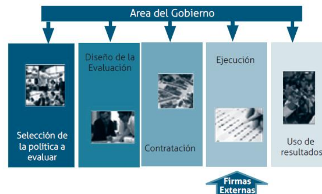
Gráfico 8. Fases de la Evaluación de Políticas Estratégicas