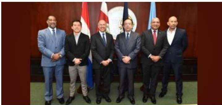
Curso Introdutorio a las Cuentas de Energía en República Dominicana. 3 al 7 de abril de 2017, Santo Domingo, República Dominicana.