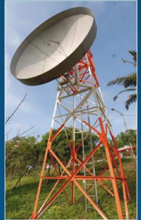
Servicios de Telecomunicaciones