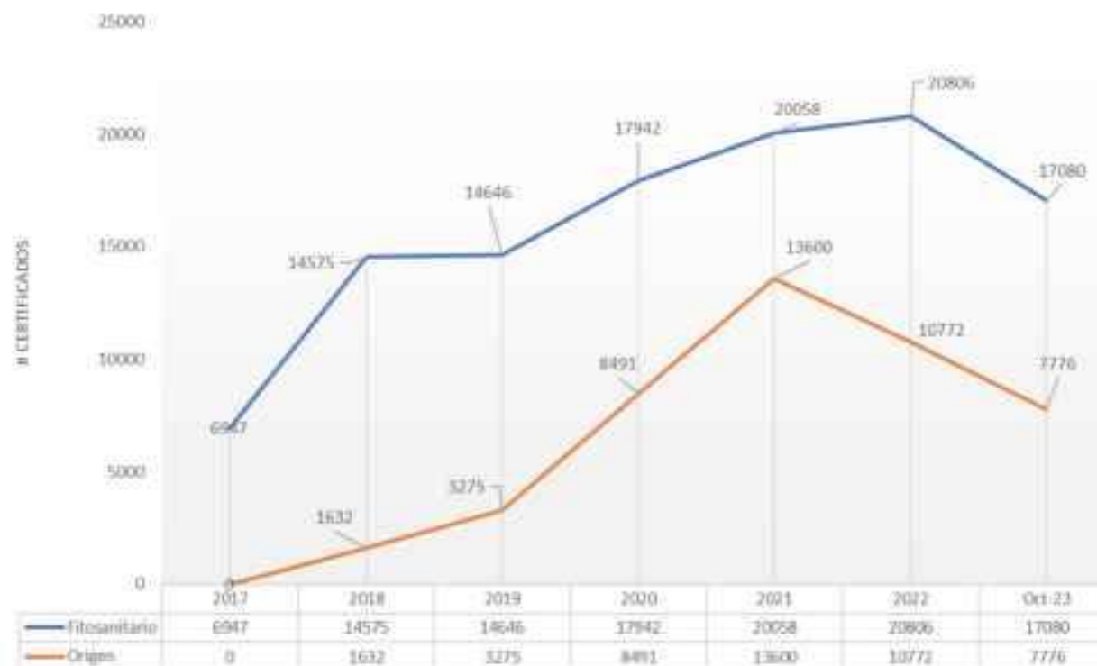
Fitosanitario / Origen