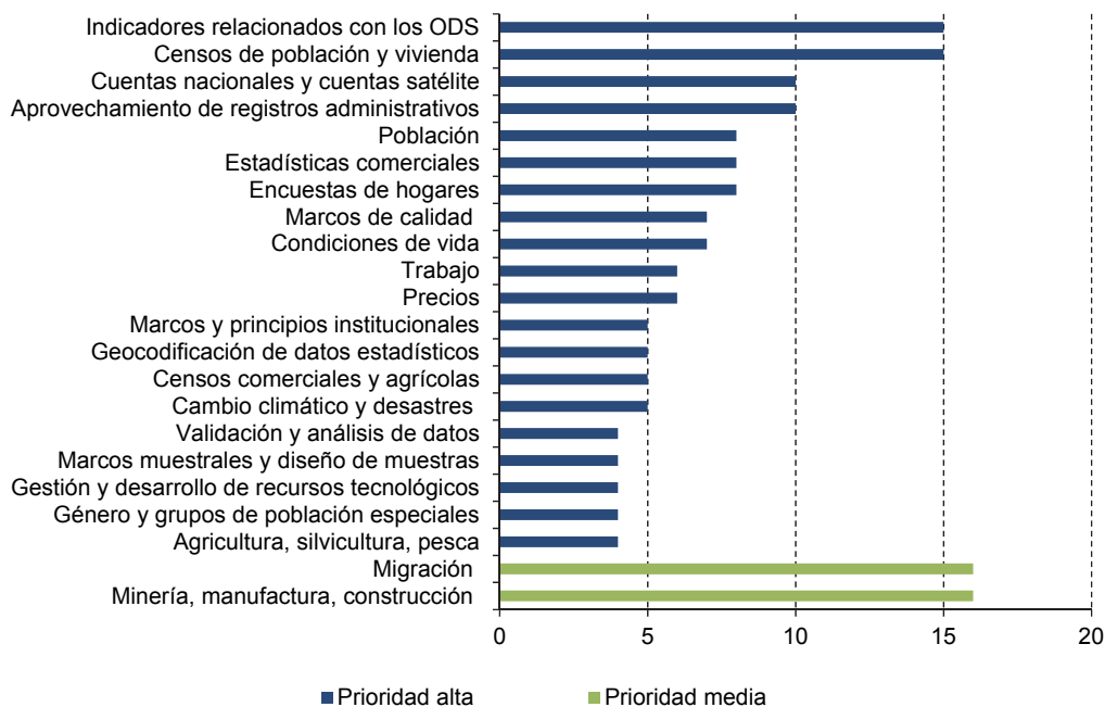
Gráfico 2 América Latina y el Caribe: clasificación de las actividades calificadas como de prioridad alta a y prioridad media b por la mayor cantidad de países (En número de países)