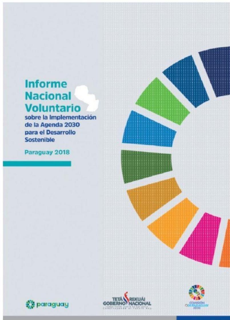
Primer Informe Nacional Voluntario