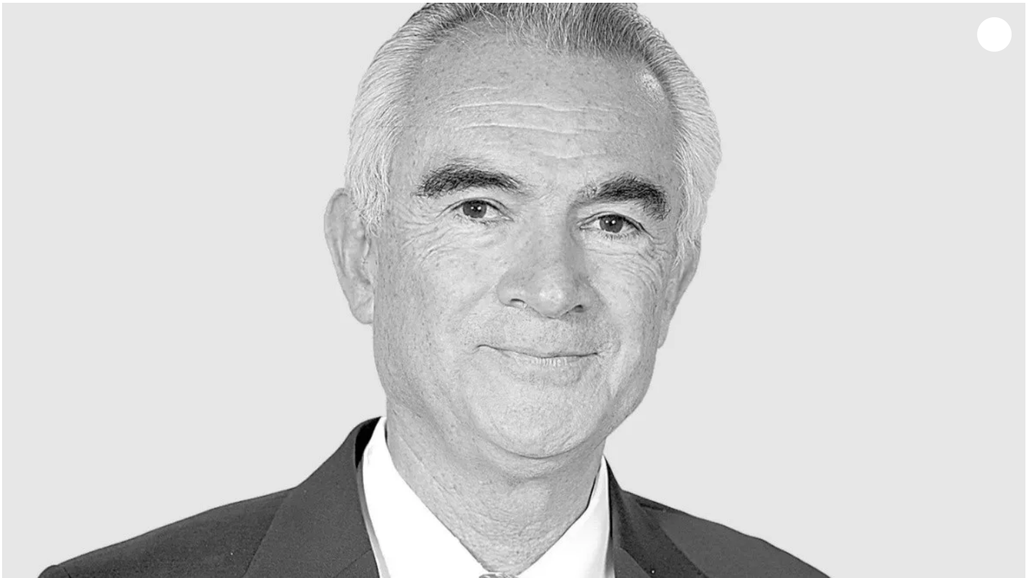
José Manuel Salazar-Xirinachs - Secretario ejecutivo de la Comisión Económica para América Latina y el Caribe (CEPAL)