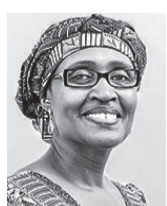
WINNIE BYANYIMA DIR. OXFAM INT.

rica Latina y el Caribe. Aunque la región ha logrado un éxito considerable en la reducción de la extrema pobreza durante la última década, sigue mostrando niveles altos de desigualdad del ingreso y de la distribución de la riqueza, que han obstaculizado el crecimiento sostenible y la inclusión social. En América