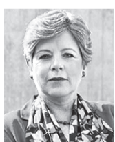
ALICIA BÁRCENA SEC. E. DE LA CEPAL

El impacto destructivo de la extrema desigualdad sobre el crecimiento sostenible y la cohesión social es evidente en Amé-