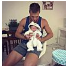
Con solo 23 años se ha convertido en padre y abuelo en la misma semana