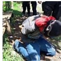
Capturan a pandillero tras tiroteo contra PNC en Usulután