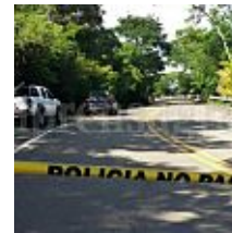
Un policía y cinco pandilleros entre los doce asesinados hoy