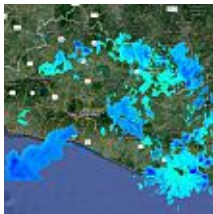
Sube de verde a amarilla alerta por lluvias en El Salvador