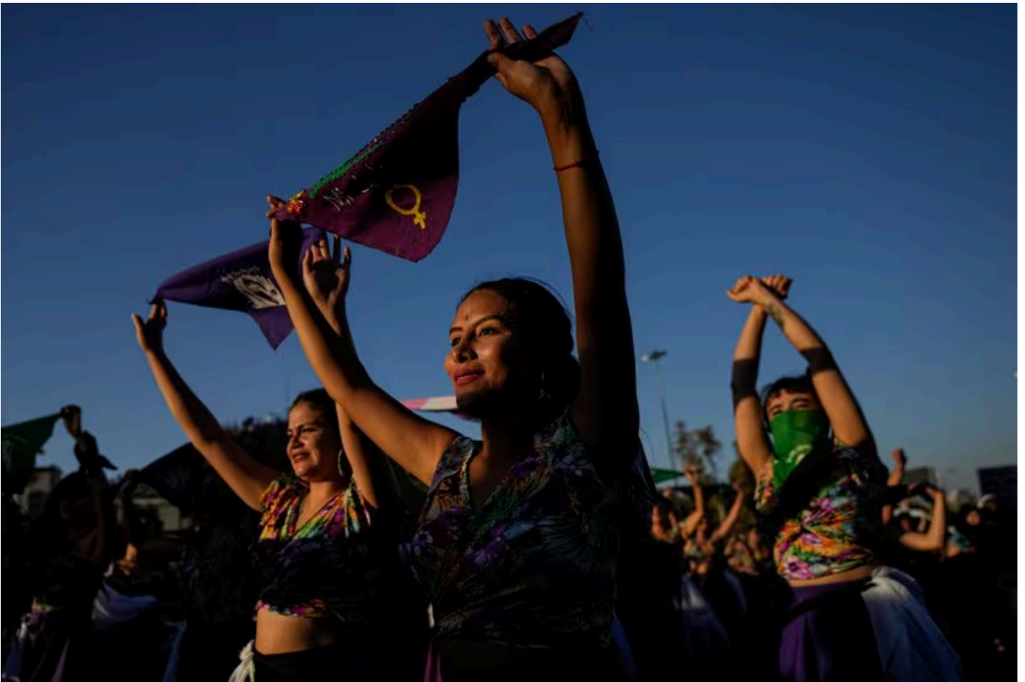
Mujeres levantan sus pañuelos durante la conmemoración del día internacional de la mujer, en 2022, en Santiago, Chile.