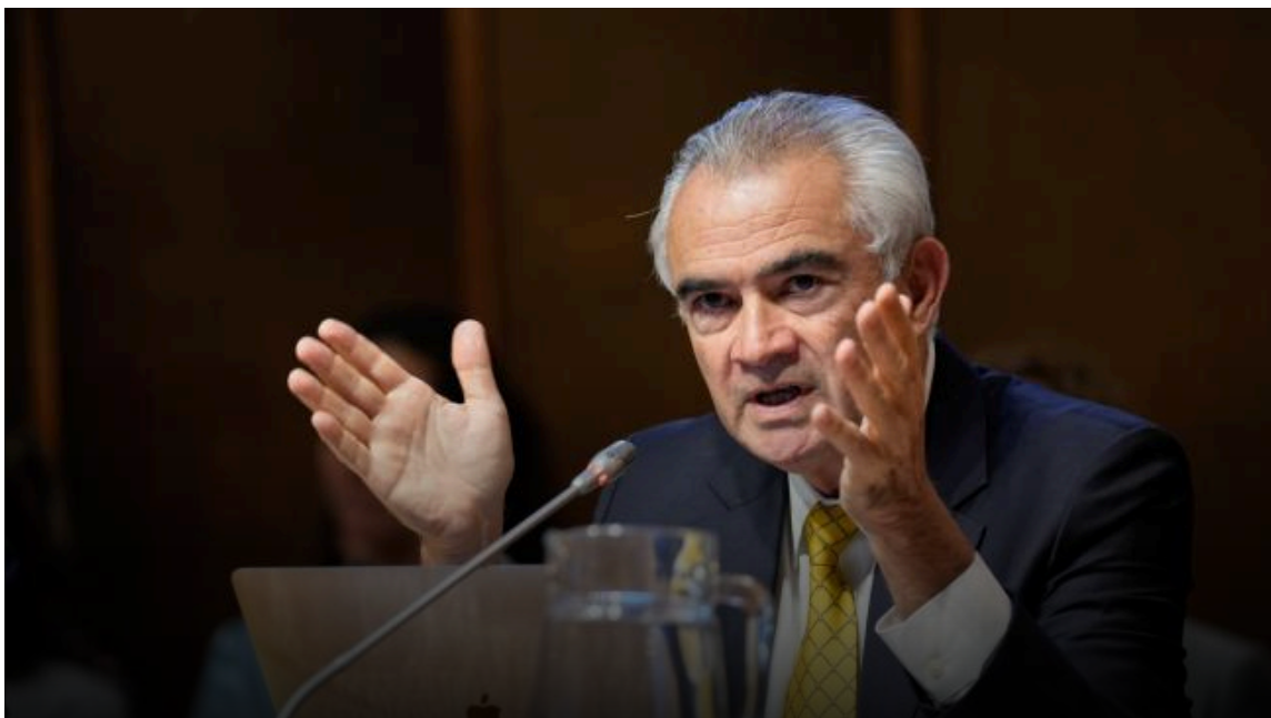
José Manuel Salazar-Xirinachs, Secretario Ejecutivo de la Comisión Económica para América Latina y el Caribe (CEPAL) de las Naciones Unidas.