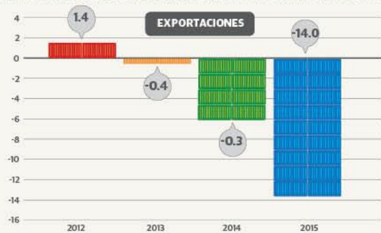
LA REGIÓN ESTÁ EN ALERTA AMÉRICA LATINA Y EL CARIBE DISMINUYERON VENTAS AL EXTERIOR (VARIACIÓN PORCENTUAL)

de uso del gasto público como instrumento contracíclico y han obligado a adoptar políticas monetarias más estrictas.