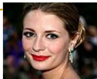
Trucos para usar lápiz labial rojo (iMujer)