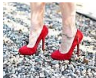
Cómo combinar zapatos rojos (iMujer)