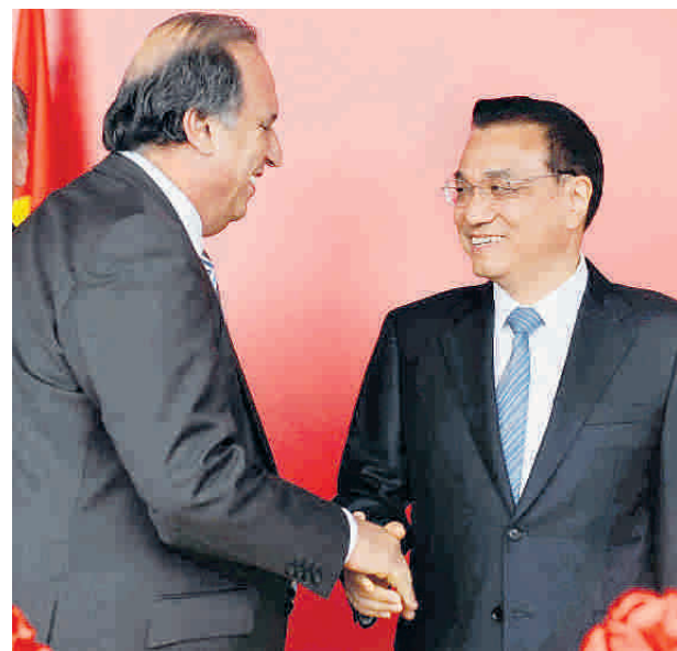
El primer ministro de China, Li Keqiang, llega hoy a Colombia dentro de la gira por A. Latina. Ayer visitó Brasil y habló con el gobernador del estado de Río de Janeiro, Luiz F. Pezão [Izq.]

La idea se discutió en su visita a China en el 2012. Hubo conversaciones con la China Railway Materials Company para realizar estudios. Según Xu Shicheng, del Centro de Estudios de América Latina y China, "probablemente el presidente Santos y el primer ministro Li hablen sobre el tema durante su actual visita". Un directivo de CNR, uno de los fabricantes de vagones de tren más grandes de China, y que quiere licitar para el futuro metro de Bogotá, dijo que no había escuchado hablar del proyecto del 'canal seco'.