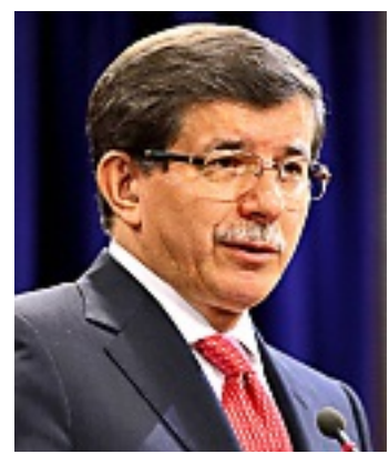
► Ahmet Davutoglu, Canciller de Turquía.