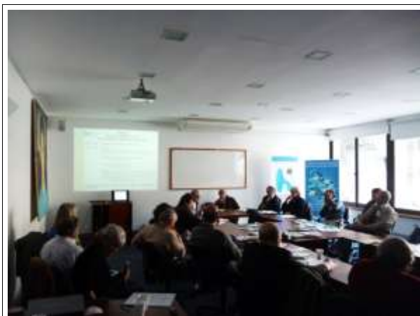
Encuentro Taller Prioridades de la Sociedad Civil para una Agenda Ambiental del Uruguay. Río +20 y DESPUÉS???

ecológica, promover energía renovables, manufacturas nacionales y locales disminuyendo transporte y fortaleciendo tejido social existente y tratamiento de efluentes y emisiones reducción de consumo, reciclaje de residuos.”