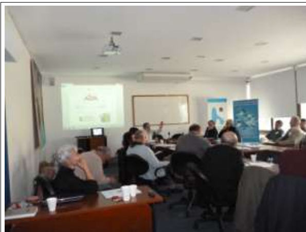
Encuentro Taller Prioridades de la Sociedad Civil para una Agenda Ambiental del Uruguay. Río +20 y DESPUÉS???

Esta es la pregunta para provocar una reflexión desde el Taller y de cara al futuro como desafío.